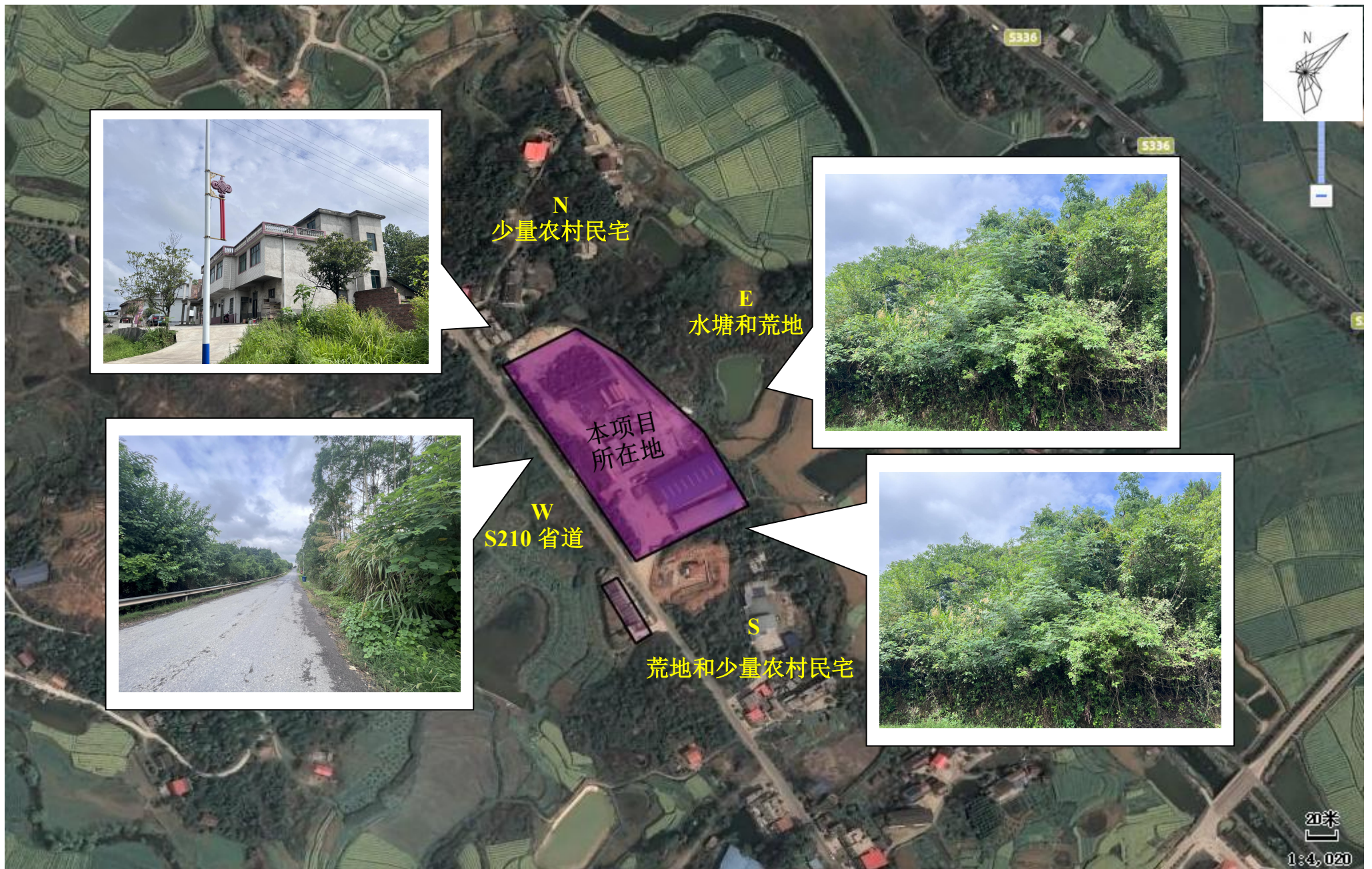
附图 3：项目四至范围图