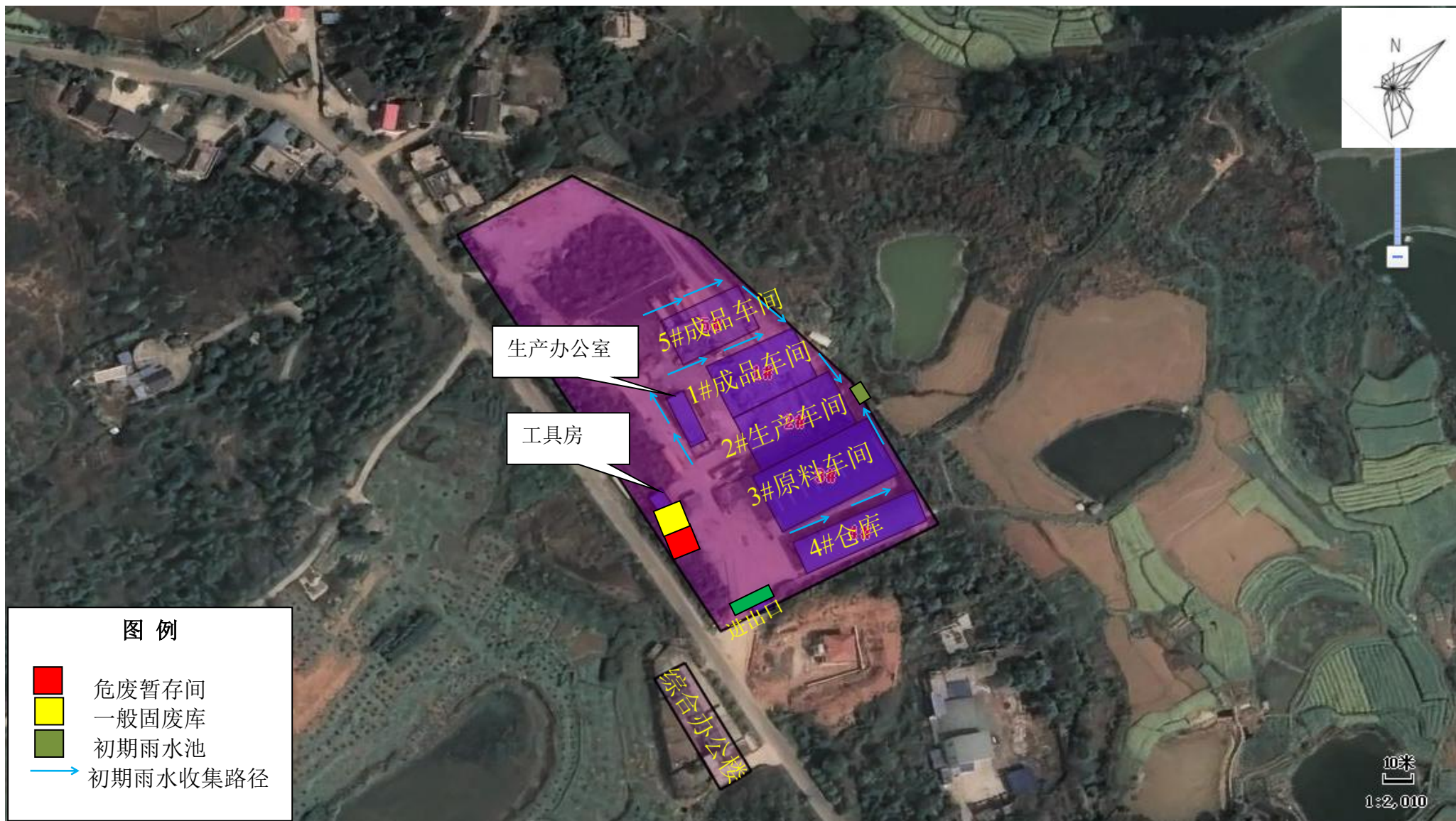
附图 2：项目平面布置图