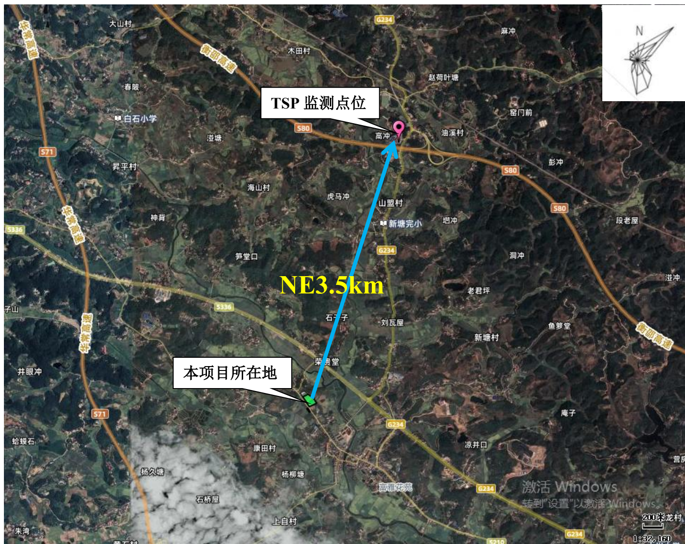
附图 6：引用 TSP 监测点位与本项目位置关系图