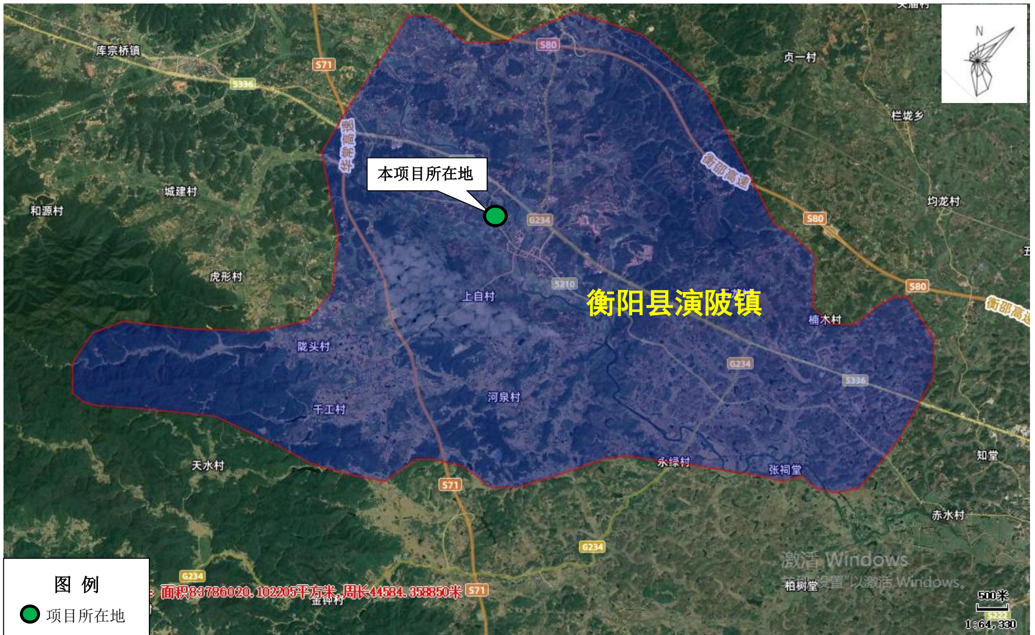
附图 1：项目地理位置图