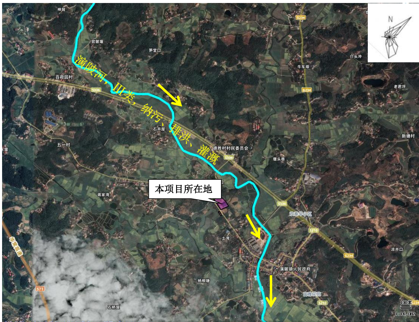
附图 5：区域主要地表水系图